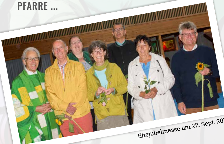
Ehejubiläum am 22. Sept. 2019

Am 20. Oktober 2019 ist es wieder soweit: die Kulturelle Welle startet!