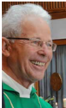
Das erbittet in dieser österlichen Bußzeit, Ihr Pfarrer

Möge der Gekreuzigte und Auferstandene uns in diese Wirklichkeit führen!