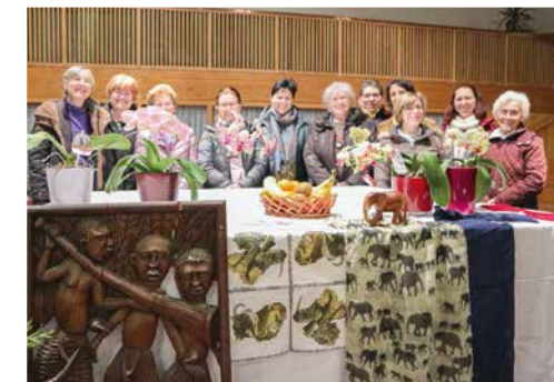
WELT- GETBETS- TAG